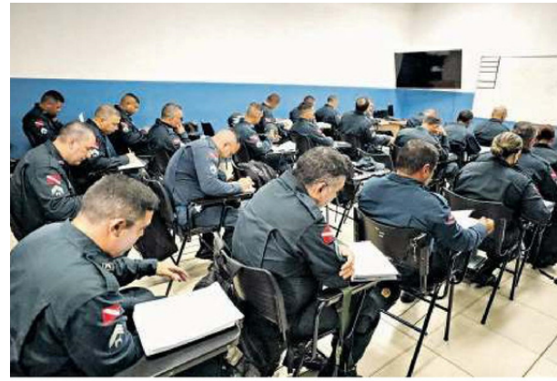
Unidade de ensino da corporação ganhará mais 20 salas