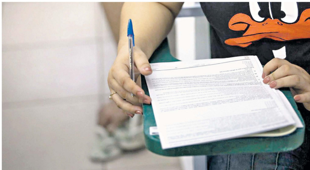
As oportunidades nos concursos públicos abertos por prefeituras do Pará são para variados cargos e níveis de escolaridade

Há vagas, por exemplo, para Agente de Vigilância Sanitária; Atendente de Consultório Odontológico; Técnico em Enfermagem; Dentista; Pediatra; Clínico Geral e Nutricionista. Há oportunidades também nas áreas de educação e adminis-