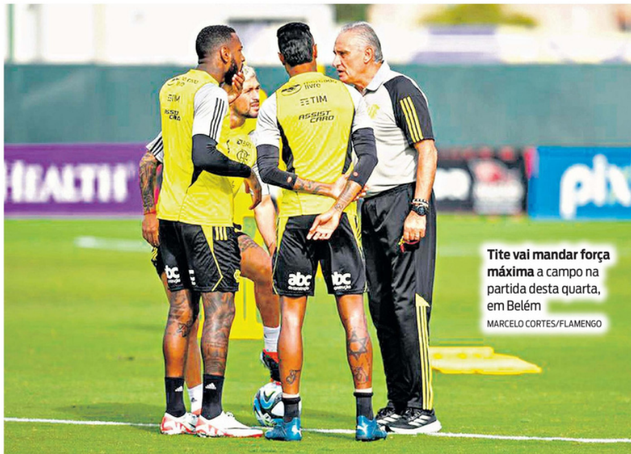
Tite vai mandar força máxima a campo na partida desta quarta, em Belém

Na preparação da equipe em solo americano, a onzena principal anotou um empate e uma vitória contra Orlando City (EUA) e Philadelphia Union (EUA), em