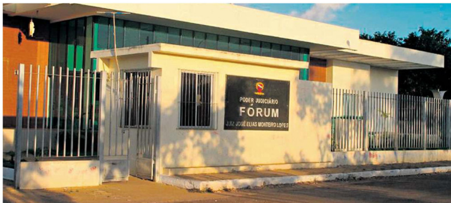
Julgamento está acontecendo no Fórum de Marabá durante toda esta quinta-feira (1º)