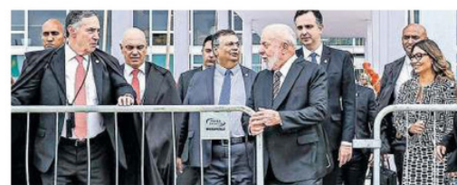
Lula, Pacheco e Barroso retiraram juntos as grades do Supremo

mocracia de hoje, nenhum deles citou o ex-presidente Jair Bolsonaro (PL), que liderou no país atritos entre os Poderes durante seu período na Presidência da República e também incentivou atos golpistas que culminaram com os ataques do 8 de janeiro de 2023.